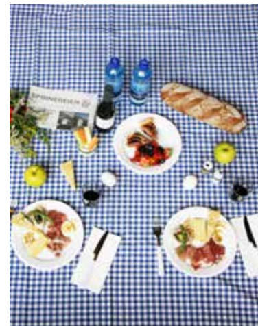
Picknick à la sagibeiz: ein wunderbares Tischlein-deck-dich.

An der Reception des lofthotels ein Picknick bestellen und je nach Bedarf geeignete Schiffstickets dazu und los geht's auf eine gemütliche Wanderung mit dem gefüllten lofthotel-Rucksack für 2 Personen, inkl. einem kleinen Fläschchen Rotwein, vielen lokalen Spezialitäten, passendem Geschirr und einer Decke. Wir empfehlen Ihnen auf Wunsch passende kleinere oder grössere Wanderungen, ein schönes Badeplätzchen und geben wertvolle Tipps. Selbstverständlich kann der Rucksack auch auf eine Bike-Tour mitgenommen werden. Auf Wunsch können auch E-Bikes gemietet werden. ■