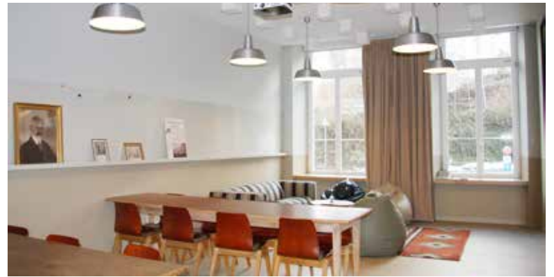
Home Office mit viel Abstand

gesamten Fang abzunehmen, in der Küche zu Fischknusperli zu verarbeiten und diese exklusiv frischer als frisch im Take away am Muttertagswochenende anzubieten. Das war ein voller Erfolg und zeigt, dass man mehrere Fliegen auf einen Schlag erlegen kann: Lokales Gewerbe unterstützen, Kundenbedürfnisse erfüllen und während Corona Aktivitäten entwickeln. ■