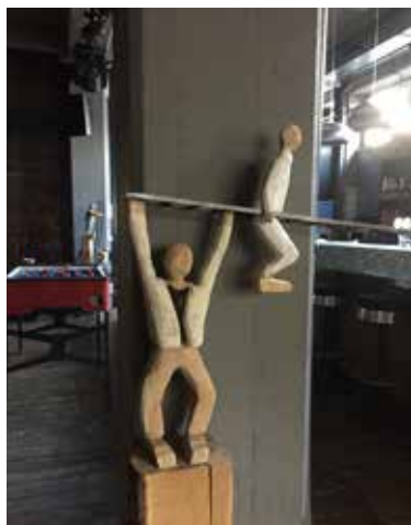
Verschiedene Kunstwerke sind auf unserem Areal zu entdecken