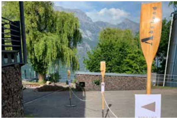
Für Sicherheit ist gesorgt