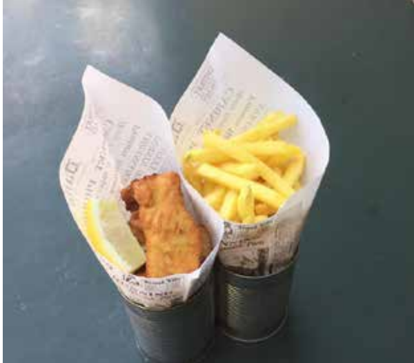
Selbstgemachte Walensee Fischknusperli