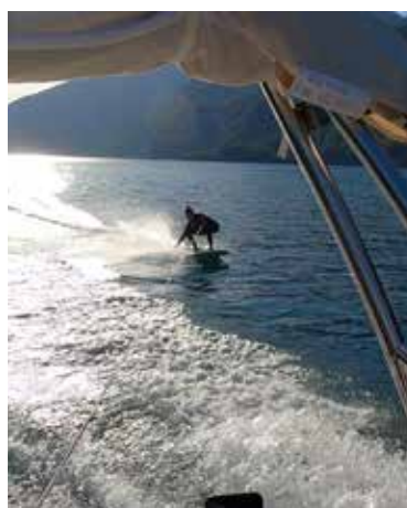
Das Wassersport Angebot am sagisteg wird stets erweitert

skaten und für kleinere Ausfahrten (auch mit Aperol!) eignet. Nun können wir vom Tête-à-Tête auf dem See bis zu kleinen Gruppenausflügen alles bieten. Sehr geeignet auch für Romantiker. ♥