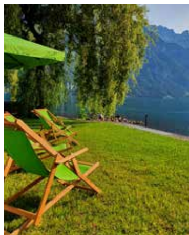
Die exklusive Liegewiese für unsere Lofthotel Gäste

skaten und für kleinere Ausfahrten (auch mit Aperol!) eignet. Nun können wir vom Tête-à-Tête auf dem See bis zu kleinen Gruppenausflügen alles bieten. Sehr geeignet auch für Romantiker. ♥