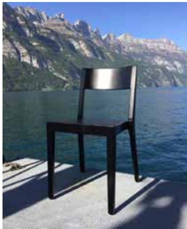
Das neue Zuhause der Horgen Glarus Stühle

Zwei Tage vor dem Shutdown waren wir noch bei Horgen Glarus, um neue Stühle zu bestellen, deren Nutzen gleich darauf in Frage gestellt wurde. Doch wie sagte Victor Hugo so schön: