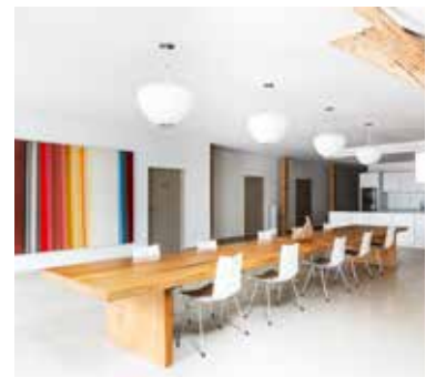
Einblick in die Loftsuite