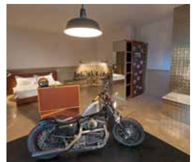
Mit dem Motorrad direkt ins Zimmer