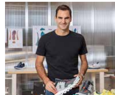
Roger Federer mit ON Schuhen

uns besucht hat, wir waren schon ON-Fans, als ON noch in einer kleinen Wohnung mit rund