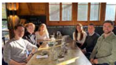
Die Studenten der EHL in der sagibeiz

Wir wollen bekanntlich nicht stehenbleiben, weshalb wir mit zusammen mit EHL (Ecole Hotelière de Lausanne) -StudentInnen das Projekt «Destination of Tomorrow» aufgelegt haben. Das Resultat: Eine Sammlung von Ideen in den Bereichen EAT, PLAY & WORK, die nun schrittweise umgesetzt werden, stets mit Fokus auf innovative Nachhaltigkeit und in Kombination mit Erlebnis & Genuss. Für die eine oder andere Überraschung ist also gesorgt!