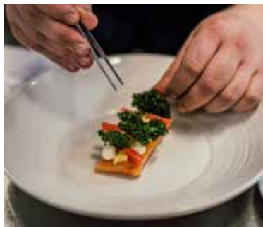
Liebevoll angerichtete Gerichte

interpretiert – und saisonalen Köstlichkeiten bestückt. Dazu kommt unsere Spezialitätenkarte, auf der sich innovative und auch etwas anspruchsvollere Gerichte finden.