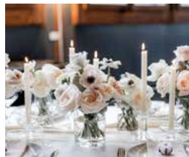
Tischdekoration in der sagibeiz

Einziger Wermutstropfen: Nicht alle Gäste erkannten die Extraleistung und den enormen Einsatz des Personals, was natürlich auch schwierig ist, wenn man nicht hinter die Kulissen sehen kann. Auch an