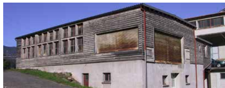
Die sagibeiz vor dem Umbau in ein Restaurant

Dieter und Esther von Ziegler haben die sagibeiz 2002 als einfachen Sommerbetrieb eröffnet, mittlerweile sind das lofthotel, der sagisteg, das Holzlager und weitere Ergänzungen dazugekommen. Aus einem kleinen Restaurationsbetrieb sind ganze Erlebniswelten entstanden, die auch den Walensee und Partnerbetriebe mit einschliessen. Die Gründer freuen sich auf die