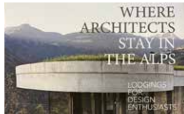
Das Buch von Sibylle Kramer

tenentschädigung von CHF 15 beim Service oder an der Reception bezogen werden. (= gutes Geschenk ☺)