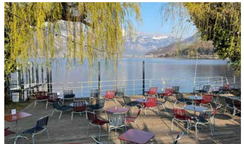
Unsere Plattform direkt am See mit den neuen Embru Gartenmöbeln

Unsere hausinternen Handwerker haben sodann zusätzliche Barplätze mit wunderbarem Blick auf den See installiert. ■