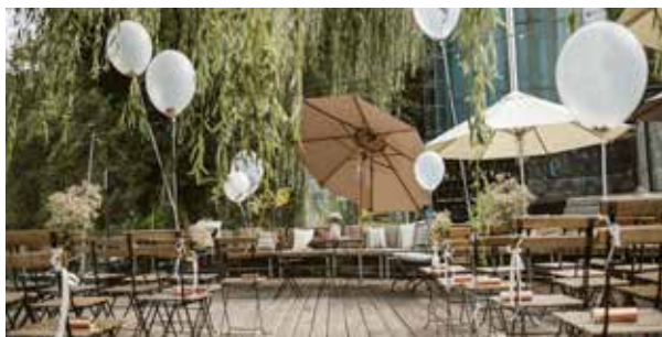
Unsere sagi Plattform

Planbar war so gut wie gar nichts! Der Lockdown zwang alle, die Kosten so niedrig wie möglich zu halten und abzuwarten, ob überhaupt wieder geöffnet werden darf. Neue Personaleinstellungen waren zu riskant. Die Hochzeiten wurden alle abgesagt, erst im Juli war es wieder möglich, das Fest der Liebe zu feiern.