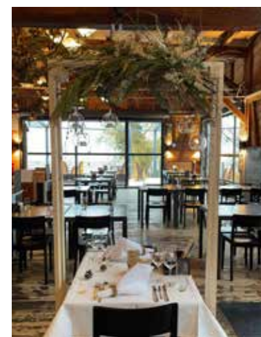
Romantisches Candle Light Dinner