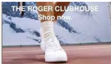
Roger Federer in unserer Tennishalle

2021 erhielten wir hohen Besuch in unserer Tennishalle. Es hat sogar für einen ON-Spot gereicht 😊. Have a look.