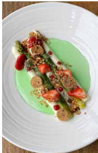
Farbenfrohe Menus der neuen Karte