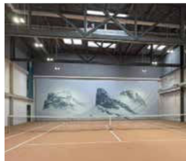
Neue LED Beleuchtung von Greentech

Auch die azibene Mitarbeiter rennen auf ON clouds für ihre Gäste! Nicht erst seit Roger