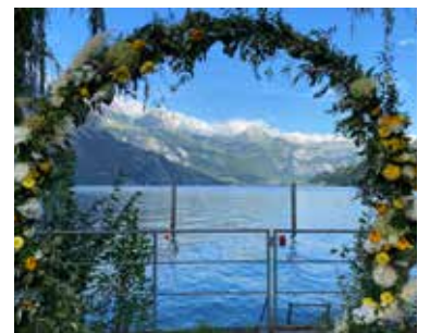
Trauungsbogen mit Panorama

Sie hat zwar erst verspätet angefangen, unsere Hochzeitssaison, dennoch waren wir jedes Mal wieder von Neuem hingerissen von den Brautpaaren, der fröhlichen Gästeschar und den traumhaften Dekorationen! Unsere verschiedenen Gestalterinnen haben jeweils top Arbeit geleistet: