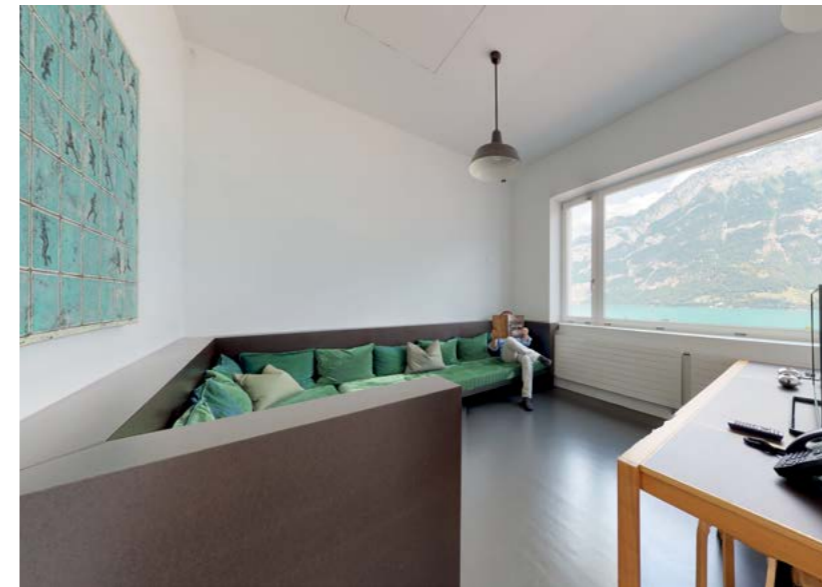
Chillbereich mit Panoramafenster Turmloft. Detail Schlafzimmer Turmloft. Panoramablick. Grundriss Loftsuite.