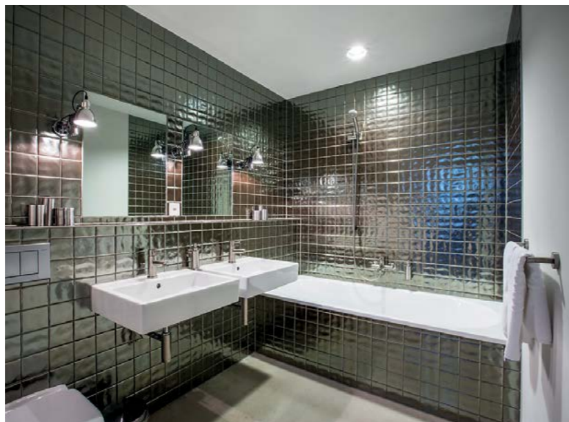
Blick Schlafzimmer Loftsuite. Detail Küche Turmloft. Badezimmer Loftsuite. Innenansicht Ess- und Wohnbereich Loftsuite.

INFORMATIONEN. ARCHITEKTUR-BÜRO> RLC ARCHITEKTEN, HERMANN UND KATHARINA STUCKI SCHMEZER // 2013. ALTE FABRIK> LOFTSUITE 330 QM UND TURMLOFT 90 QM // 4 UND 8 GÄSTE // 2 UND 4 SCHLAFZIMMER // 1 UND 2 BADEZIMMER. ADRESSE> ALTE SPINNEREI, MURG AM WALENSEE, SCHWEIZ. WWW.LOFTHOTEL.CH/UEBERNACHTEN/FERIENWOHNUNGEN/